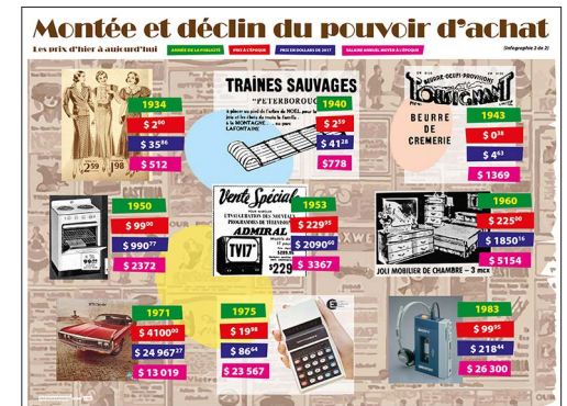
LAPORTE, Gilles, « Montée et déclin du pouvoir d'achat », Infographies.quebec , Québec, Septentrion, 2018.